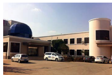
上海礼愛頤養院: 外観

http://www.jiading.gov.cn/Government/PublicInfo/27791/Show.aspx